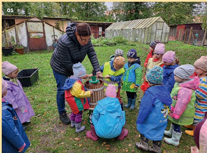
01 Jablkobraní 02 Na návštěvě 03 Zdobení hnětynek